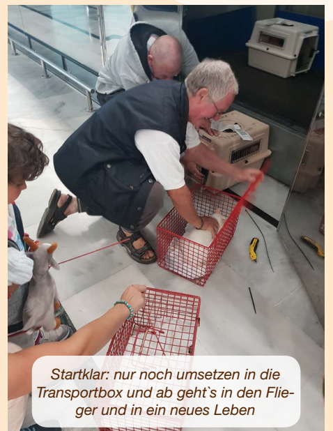
Startklar: nur noch umsetzen in die Transportbox und ab geht's in den Flieger und in ein neues Leben