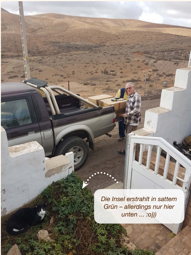
Die Insel erstrahlt in sattem Grün – allerdings nur hier unten ... :o)))