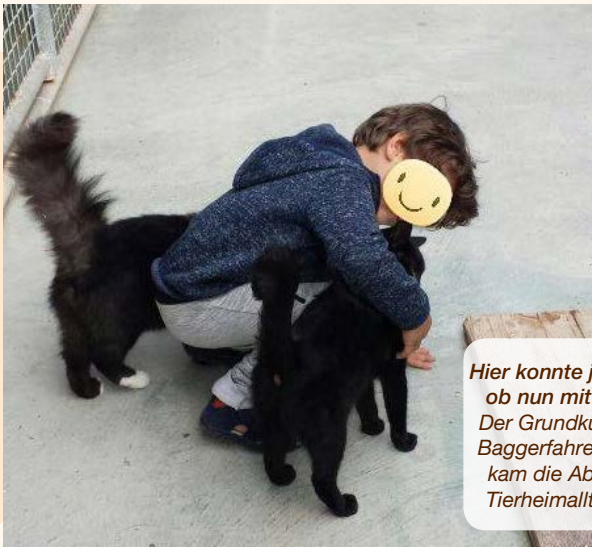
Hier konnte jeder mitmachen, ob nun mit Fell oder ohne: Der Grundkurs für zukünftige Baggerfahrer. ;o) Den Miezzen kam die Abwechslung zum Tierheimalltag gerade recht